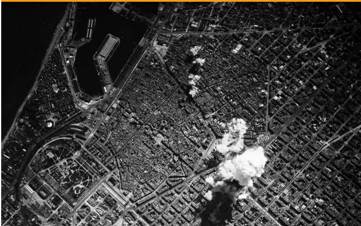
Instantània dels atacs aeris que va patir Barcelona durant els primers mesos de 1937.

L'exhortació de Churchill als londinencs que encapçala aquestes ratlles no és altra cosa que el reconeixement d'una lluita titànica entre les bombes i la població civil organitzada. Una lluita que cal recordar amb orgull.