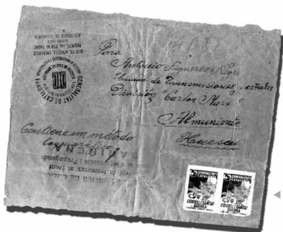
Paquet postal enviat per als Boy Scouts de Catalunya al front de Sariñena (Osca) a través del Servei d'Informació i Propaganda.

Els Boy-Scouts de Catalunya organitzaven sovint campaments provisionals a la Plaça de Catalunya de Barcelona per recollir llibres i publicacions, per tal de ser enviats al front.