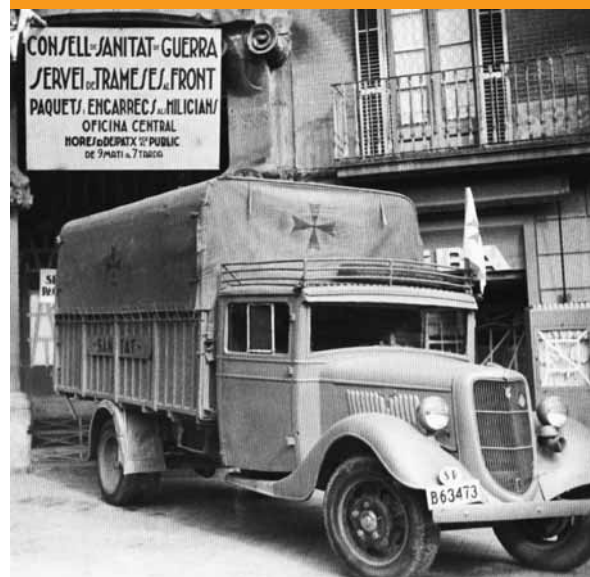
Camió sanitari davant de l'oficina central del Consell de Sanitat de Guerra de la Generalitat de Catalunya, a Barcelona.