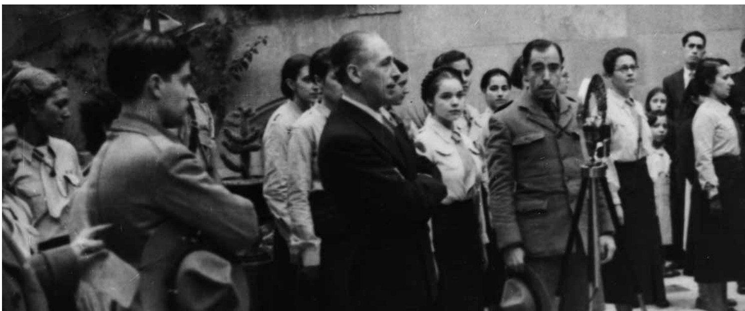
Monogràfic 3 · Escoltisme en temps de guerra