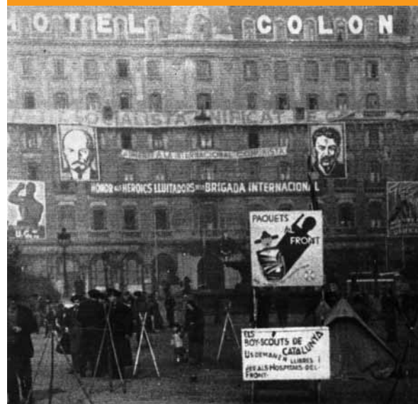
Paradeta dels Boy-Scouts de Catalunya a la Plaça de Catalunya de Barcelona per recollir llibres per als hospitals del Front.

Els Boy-Scouts de Catalunya organitzaven sovint campaments provisionals a la Plaça de Catalunya de Barcelona per recollir llibres i publicacions, per tal de ser enviats al front.