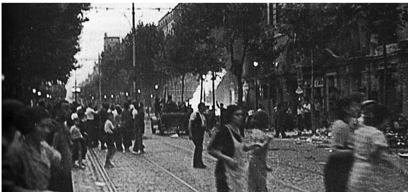
Instantània dels atacs aeris que va patir Barcelona durant els primers mesos de 1937.

per aplicar als treballs col·lectius i s'iniciava l'obra amb la participació majoritària de dones, infants i gent gran, que extreïen el material de les llambordes aixecades durant la defensa contra la revolta de l'estiu del 1936, les esglésies i els convents cremats i les mateixes cases enderrocades per l'efecte de les bombes enemigues.