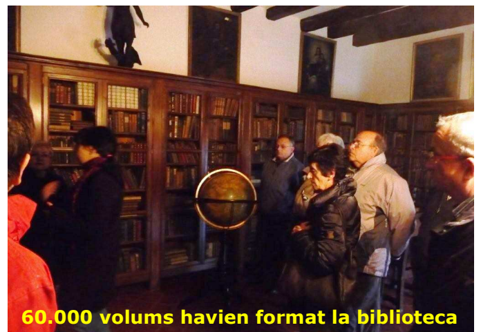
60.000 volums havien format la biblioteca

La visita guiada ens va permetre veure amb tranquil·litat tot el conjunt. Únicament ens va faltar poder pujar fins a l'ermita de Santa Bàrbara situada a pocs metres de distància, i que permet divisar un panorama sensacional sobre les terres del Camp de Tarragona. La pluja torrencial i la boira ens van privar d'aquest premi.